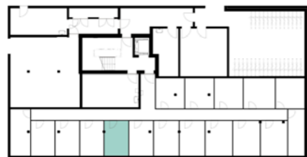
Untergeschossübersicht (Haus 4)