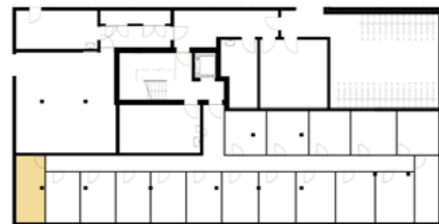
Untergeschossübersicht (Haus 4)