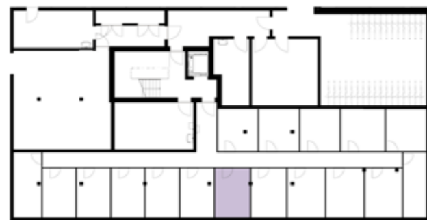
Untergeschossübersicht (Haus 4)