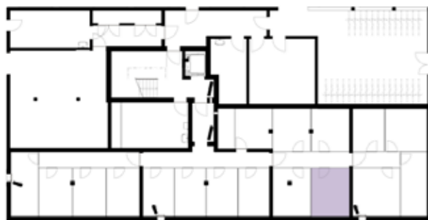
Untergeschossübersicht (Haus 5)