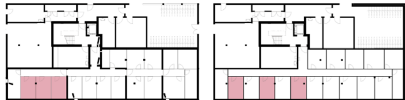
Untergeschossübersicht (Haus 5)