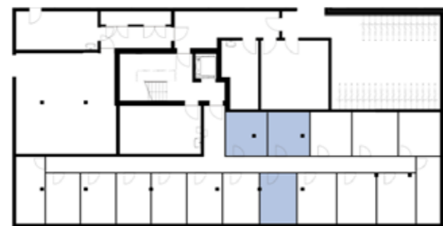
Untergeschossübersicht (Haus 4)