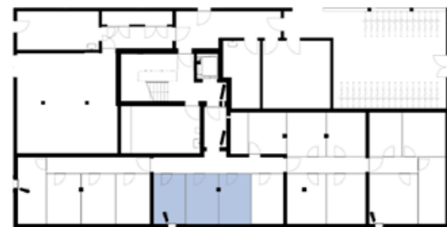
Untergeschossübersicht (Haus 5)