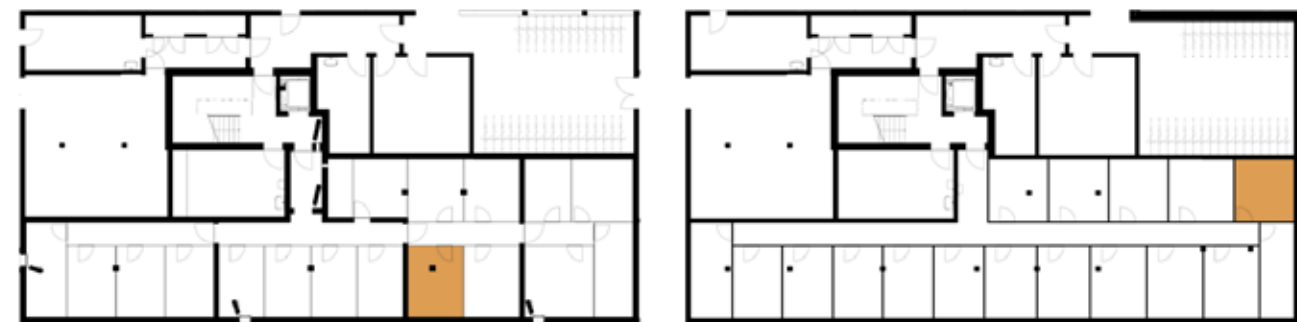
Untergeschossübersicht (Haus 5)