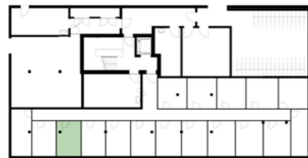
Untergeschossübersicht (Haus 4)