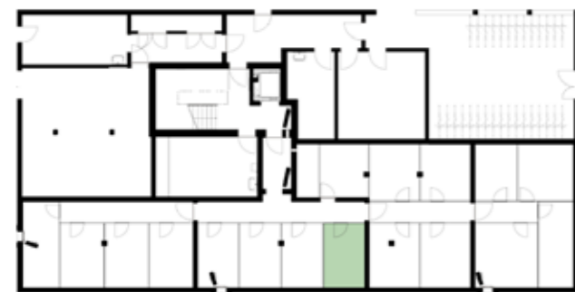
Untergeschossübersicht (Haus 5)