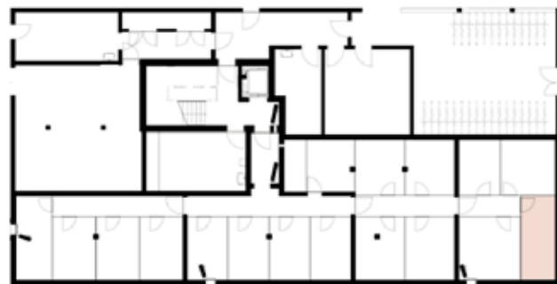
Untergeschossübersicht (Haus 5)