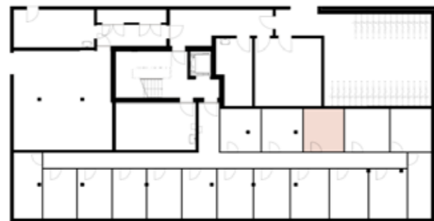
Untergeschossübersicht (Haus 4)