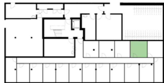
Untergeschossübersicht (Haus 4)