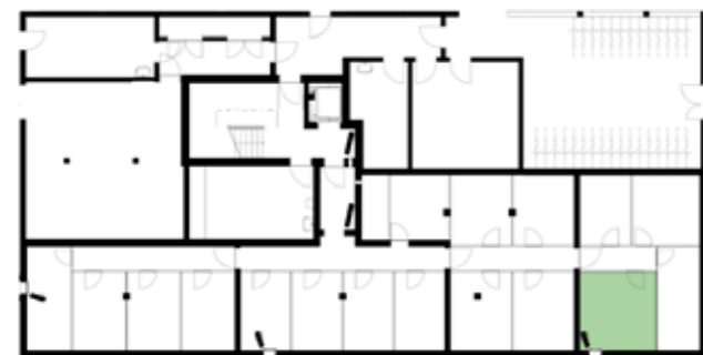
Untergeschossübersicht (Haus 5)